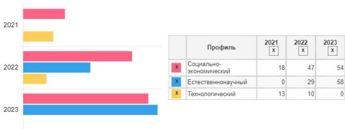
Профили, которые выбирали обучающиеся

Естественно-научный профиль (10 «Б», 11 «Б» класс) формирует научное мировоззрение на основе знакомства с формами и методами научного познания, изучения основных биологических и химических теорий, формирования навыков самостоятельной исследовательской деятельности, раскрытия роли естественных наук как производительной силы. Он ориентирует на такие сферы деятельности, как медицина, биотехнологии и др.